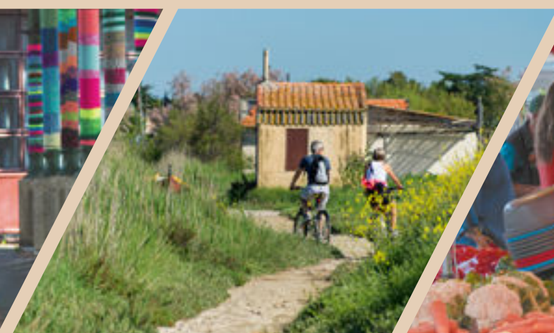
Les sentiers de l'Étang de l'Or