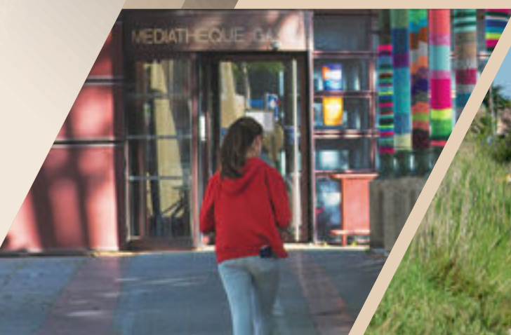
Médiathèque Gaston Baissette

NAOS s'inscrit sur un site privilégié à quelques encablures des commerces, infrastructures scolaires et sportives qui vous offriront tout le confort de vie du quotidien.