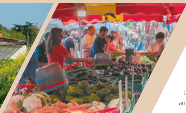
Le marché hebdomadaire