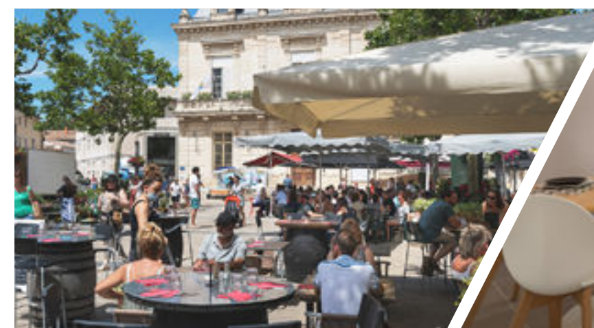
Place de la Libération Charles de Gaulle

Diversité de l'habitat, cheminements doux, pistes cyclables, espaces de verdure, équipements sportifs, jardin pédagogique, arrêt de bus ou aire de covoiturage à moins de 5 minutes : la commune s'accorde aux nouveaux modes de vies et offre un quartier que l'on voudrait ne plus quitter !